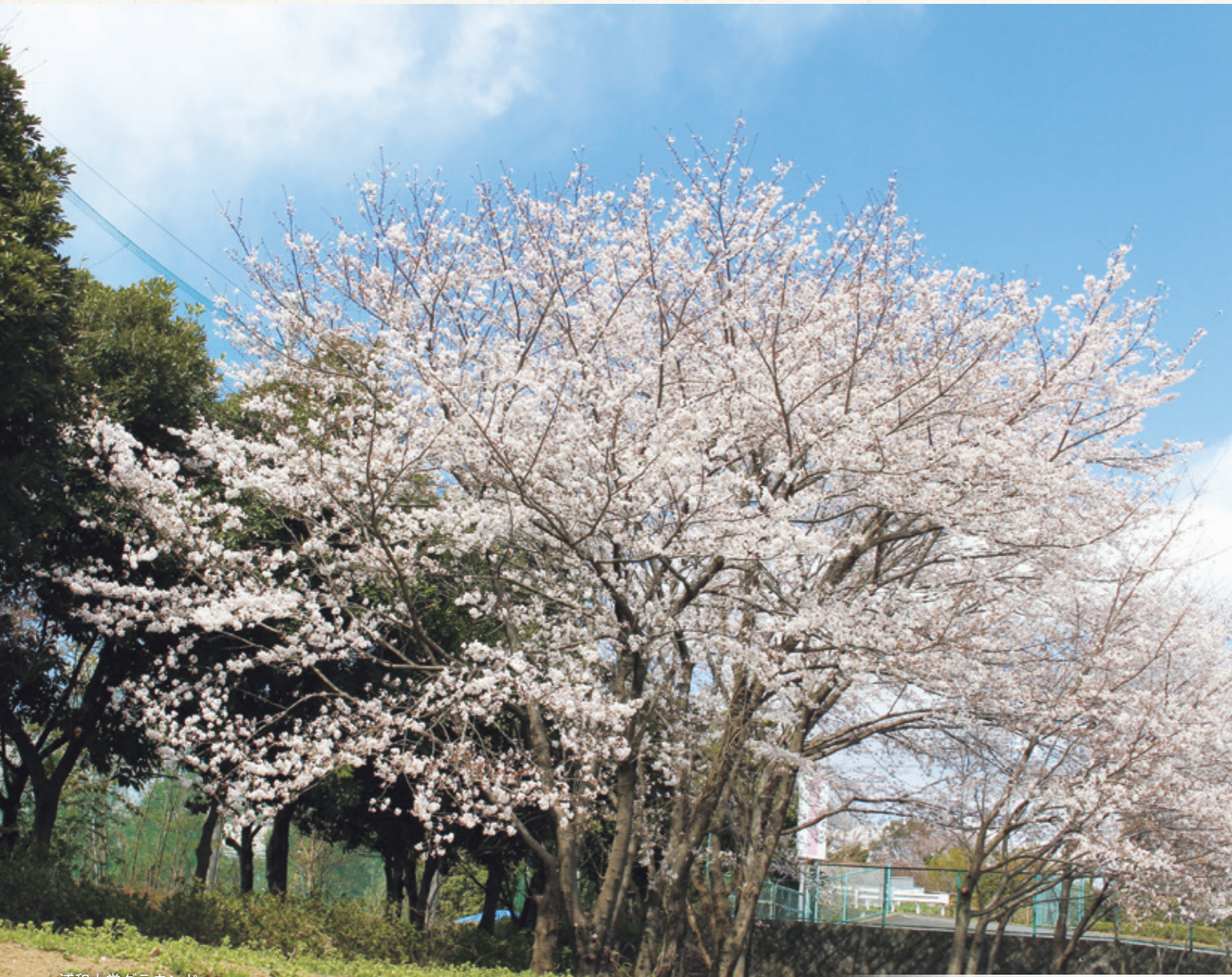
浦和大学グラウンド