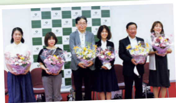
▲退任役員の皆様お疲れ様でした