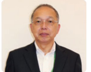
浦和大学・浦和大学短期大学部 総務課長(保護者会幹事)

また、スクールバスを増便し、乗車する人数を定員の半分程度に制限、換気を行い、密にならないよう対応いたしました。