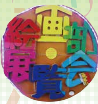
絵画部展覧会 来場者の方に絵を描いてもらい、記念写真を 撮ります。(総合福祉学 科4年 新田さん)