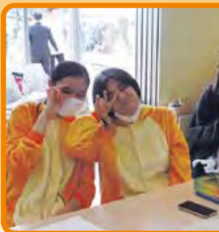
かたぐん中華まん 餃子まんが人気です。着ぐるみで営業しています。