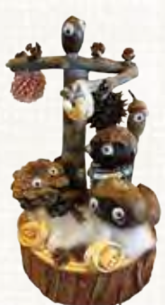
《記事》広報部 高野吉教

工作は「エコグリーン」と「森のクラフト」を制作しました。「エコグリーン」とは、ペットボトルを再利用したカラフルな砂を小さなガラス瓶に入れ植物を育てるもの