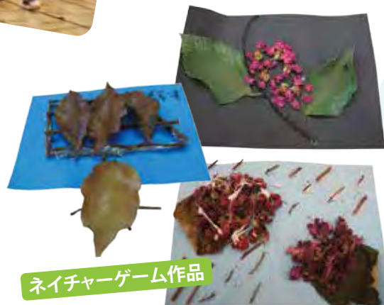
ネイチャーゲーム作品