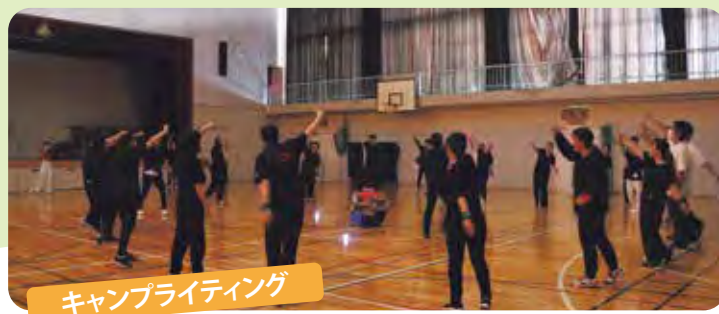
キャンプライティング