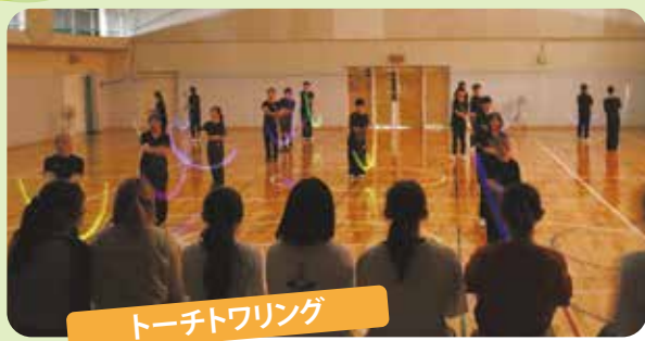
トーチトワリング