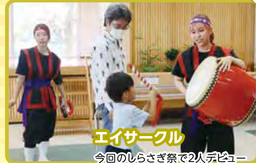
エイサーグループ 今回のしらすさぎ祭で2人デビューします。皆で盛り上がりましょう!