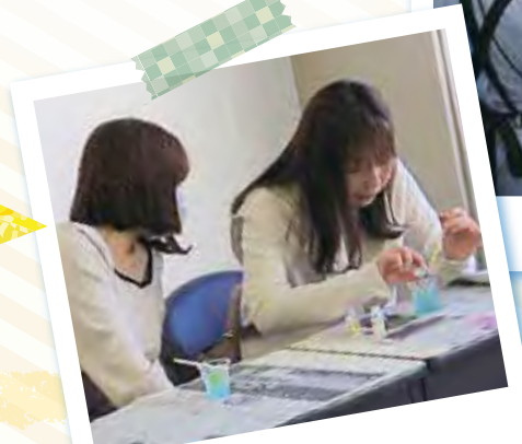
《記事》企画部部长 白倉紀子