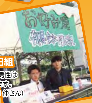
チョコリゴ♥平成綿あめ 平成ギャルもいます。