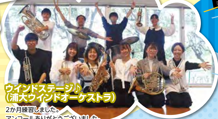
ウインドステージ (浦大ウインドオーケストラ) 2か月練習しました。 アンコールありがとうございました。