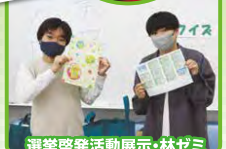
選挙啓発活動展示・林ゼミ 模擬選挙クイズやっています。