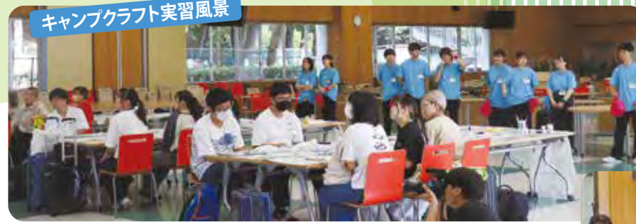
キャンクラフト実習風景