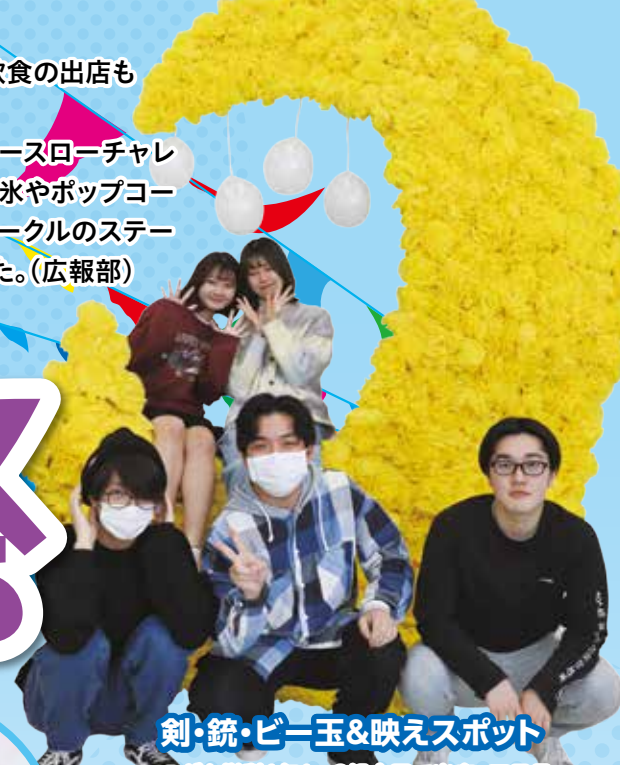
剣・銃・ビー玉&映えスポット 子ども学科1年1~3組合同で出店。三日月をイメージしたフォトスポットに花400個!