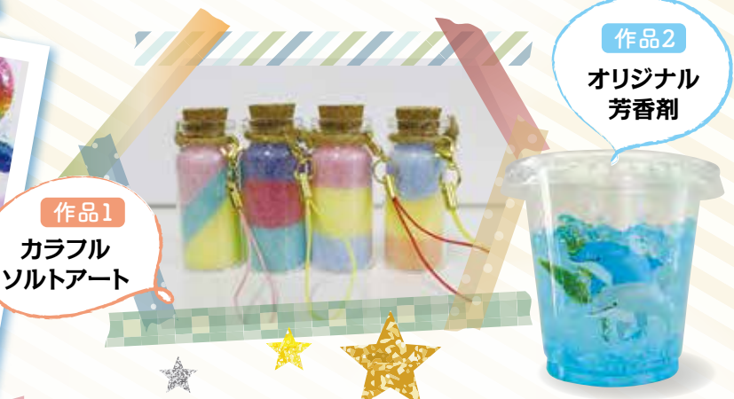
作品1 カラフル ソルトアート