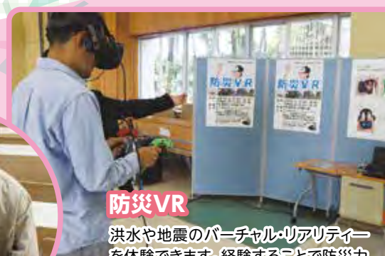
防災VR 洪水や地震のバーチャル・リアリティを体験できます。経験することで防災力を高めましょう。