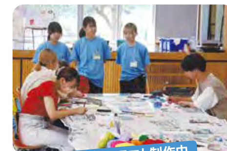
キャンクラフト制作中