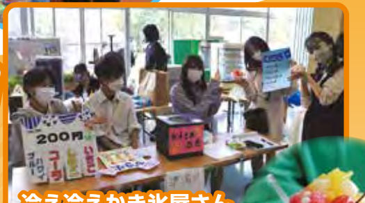
冷え冷えかき氷屋さん 少し寒くなってきましたが、ホットなしらすさぎ祭に最適です。レトロなマシンは学生の私物です。