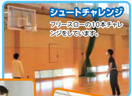
シュートチャレンジ フリースローの10本チャレンジをしています。