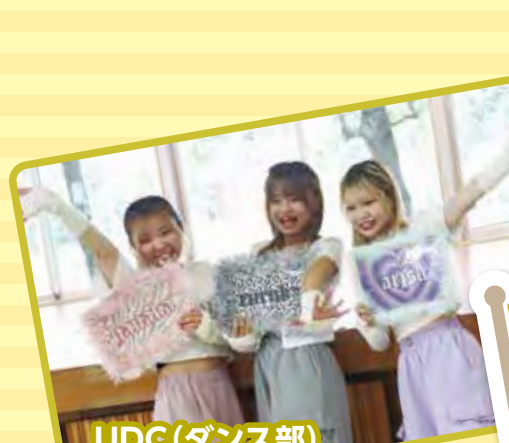
UDC(ダンス部) 大声援ありがとう!(女子3人組)