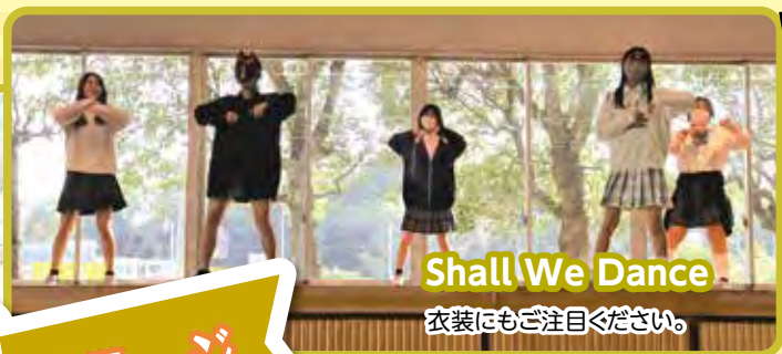
Shall We Dance 衣装にもご注目ください。