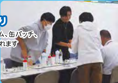
スライム作り 100円でスライム、缶バッチ、プレスレットが作れます