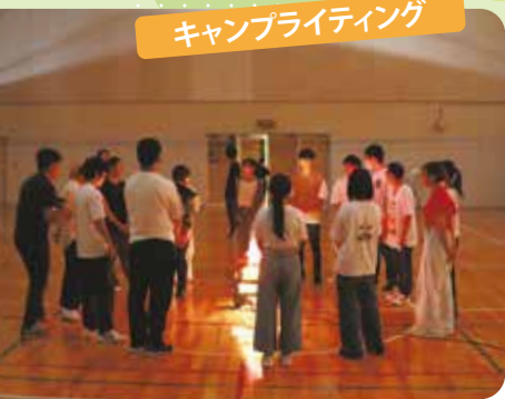
キャンプライティング