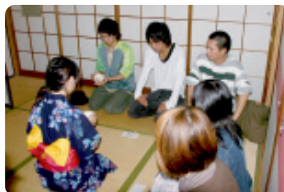
▲ お茶席も用意されています