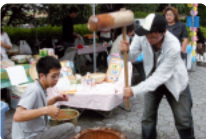
▲ 学生のごちないお餅つき。でも、つきたてはおいしい