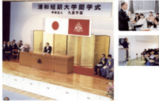
1967年4月開学式(左側が短期大学部)