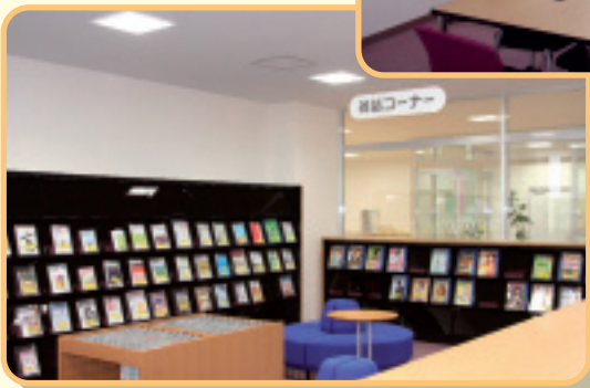
▲ 雑誌コーナー(図書館内)。 くつろげる雰囲気雑誌を閲覧できる