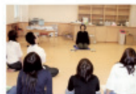
こども学部 児童の教室の様子