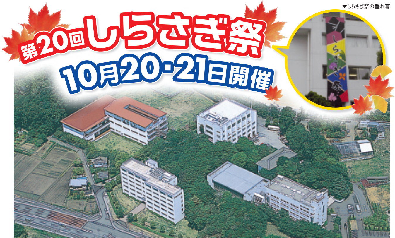
▼しらすぎ祭の垂れ幕

発行日：2007年8月30日 発行所：浦和大学・浦和大学短期大学部 入試広報室 さいたま市緑区大崎3551 TEL：048-878-5536 FAX：048-878-5690