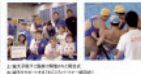
上記大会で、緑区立緑区立小学校の児童が ボランティア活動として、大会の運営に協力し、 大会の成功に貢献した。大会の運営に協力した 児童は、大会の成功に貢献した。大会の運営に 協力した児童は、大会の成功に貢献した。