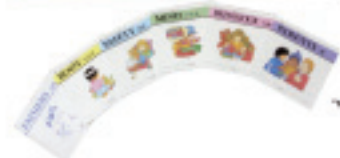
"Nobody's Perfect" の活動の様子 (2007年)