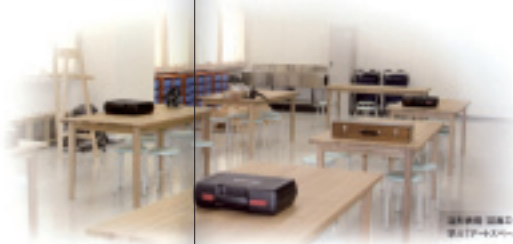
こども学部 児童の教室 (2007年4月)