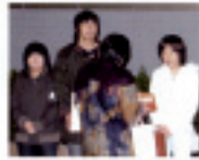
東区立緑区立小学校の児童が、災害募金 活動に参加し、募金を活動した