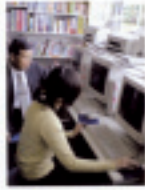
就職支援センターの職員と学生が履歴書を確認している様子