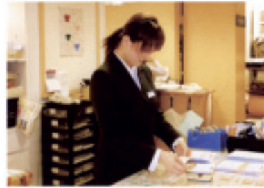
浦和大学短期大学部インターンシップセンターの職員と学生