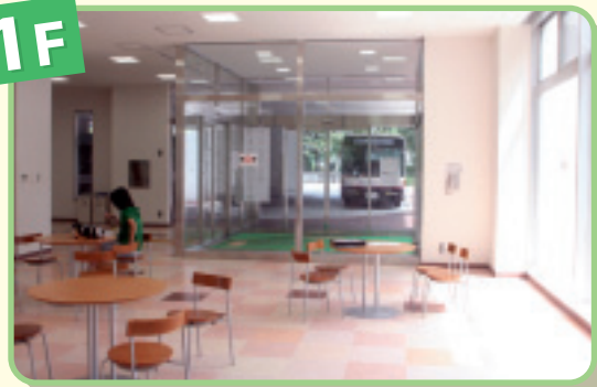
1階待合室からバス発着場を望む ▶