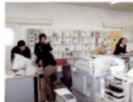
福祉教育センターでの福祉教育活動の様子