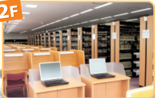
▲ 2階窓際三方は概ね閲覧席。 手前のパソコンは、書籍検索用