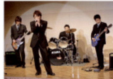
音楽サークルの演奏の様子