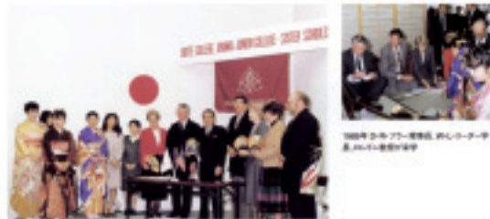
1980年2月、アメリカ・カリフォルニア州、ビュートカレッジと姉妹提携合意書の交換