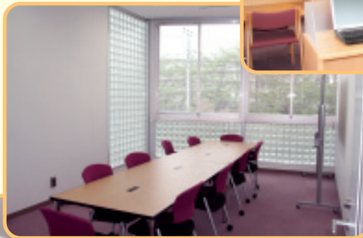
◀ 図書館内にある多目的学習室