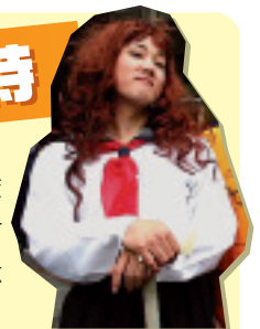
▲「にせやっくん」も登場した昨年の学園祭。本物よりもかわいい?という声も

詳細については出演者の決定次第、ホームページ http://www.uradainyushi.jp/04ikou/shirasagi.html で掲載します。入場は無料ですが、 キャンパス見学会に参加された受験生には、招待席をご用意します。