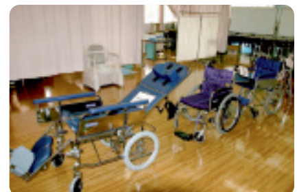
▲ さまざまな介護用具も展示されます